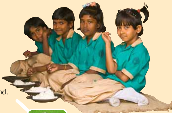
Kinder in Bangladesch freuen sich aufs Mittagessen.

„Das Kinderzentrum ist ganz toll!“ erklärte der Freund.