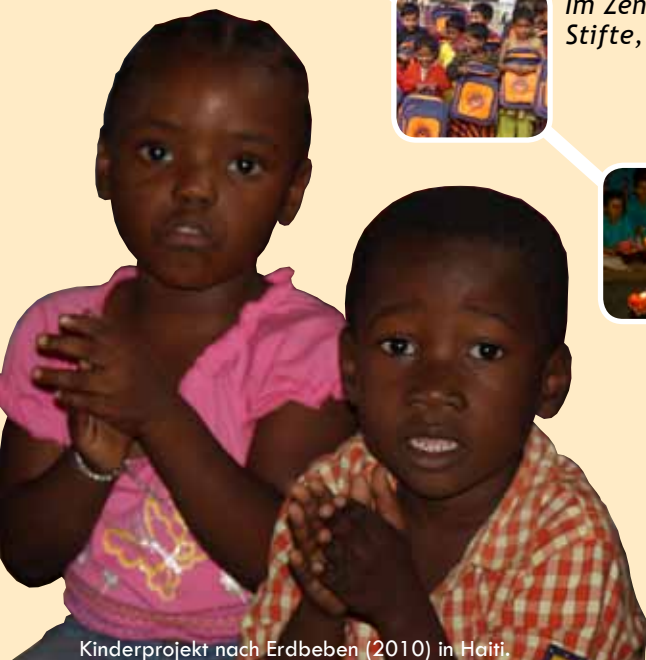
Kinderprojekt nach Erdbeben (2010) in Haiti.

Die Lehrer sind sehr nett und kümmern sich um jeden von uns. Und das beste: Es ist alles kostenlos!“